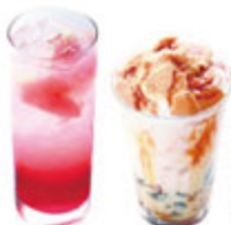
●「ラスベリーとグレープフルーツソーダ」・「ゼリーIN風みつきなこミルク」各700円

葵区福田ヶ谷の大塚ぶどう園が手塩にかけて育てたシャインマスカットやピオーネをはじめ、ブドウのソルベやパナアイス、ヨーグルトなどの層が重なり合うぜいたくパフェ。食べ進むたびに変わる食感や味わいのハーモニーを楽しんで!