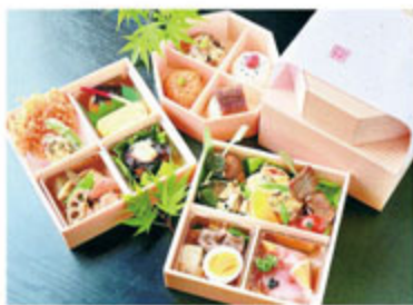
●ランチの福袋ざるうどんセット(夏野菜と海鮮天ぷらを添えて)好評続中

静岡市葵区昭和町6-2 アイワンビル10F ご予約・ご注文専用ダイヤル・FAX TEL 0120-301-450 FAX.054-254-4025 不定休 ①11:30~14:00(L.O13:30) ②17:00~24:00(L.O23:30) http://sawa-shizuoka.com/