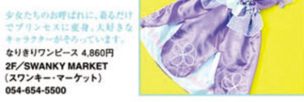
少女たちのお呼ばれに、着るだけでプリンセスに変わる。大好きなキャラクターがそろう。なりきりワンピース 4,860円 2F/SWANKY MARKET(スワンキーマーケット) 054-654-5500