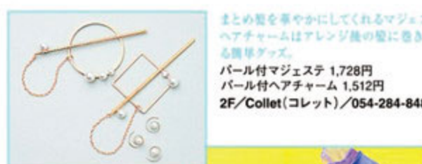
まとめ髪を華やかにしてくれるマジェスタ。ヘアチャームはアレンジ後の髪に巻き付ける簡単デコ。 パール付マジェスタ 1,728円 パール付ヘアチャーム 1,512円 2F/Collet(コレット)/054-284-8480