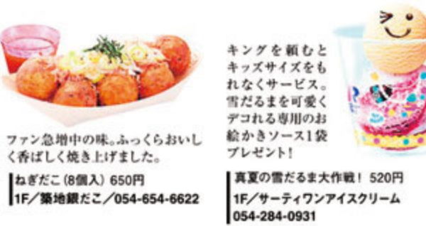
ファン急増中の味。ふっくらおいしく香ばしく焼き上げました。 ねぎだこ(8個入) 650円 1F/築地館だこ/054-654-6622