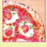
アステン5つ星 ピザ