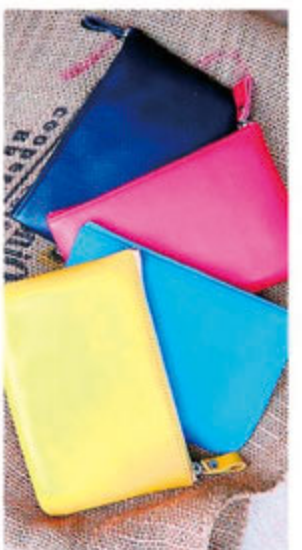
パキッと鮮やかな色合いのポーチは 使うほど柔らかくなじむレザー。色違 いで持ってもかわいい。 牛革ポーチ/各色 ¥2,500

SHOP INFORMATION Fosset 静岡市葵区東三3-20-11 営/11:00~19:00 休/水、木 tel:054-293-5000