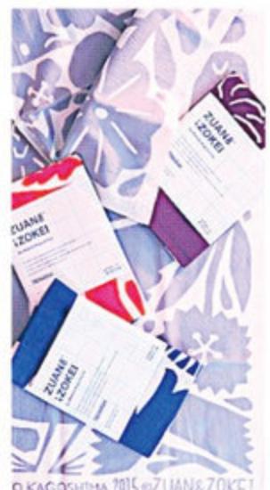
© KAGOSHIMA 2015 © ZUAN & ZONEI 鹿児島島屋さんデザインの手ぬいちはタ ベストリーのように飾ったりテーブル センターにしても。 TENGUIGI/各 ¥1,800