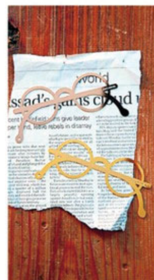
好きな本の間に挟んで一緒にプレ ゼント。きれいなリボンを選んで結 わせても。 めがねしおり/各 ¥700