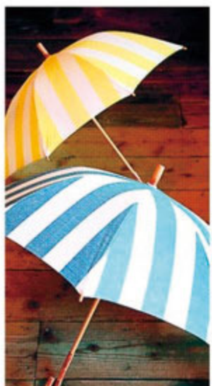
晴れでも雨でもうれしい、UVカット、 はっ水加工。お出掛けが待ち遠しく なる。 晴雨兼用長傘/¥15,000