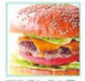
アステン5つ星 ハンバーガー