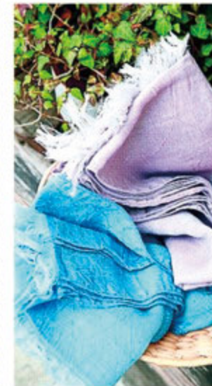
タオルで有名な今治産のストールは、 ウール混で優しい肌触り。ナチュラル な色合いでコーディネートしやすい。