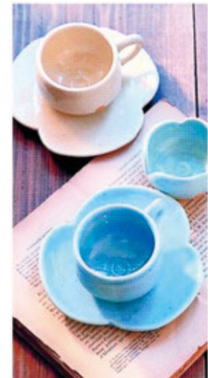
お気に入りの器があれば、それだけ でお茶の時間はもっと楽しくなる。