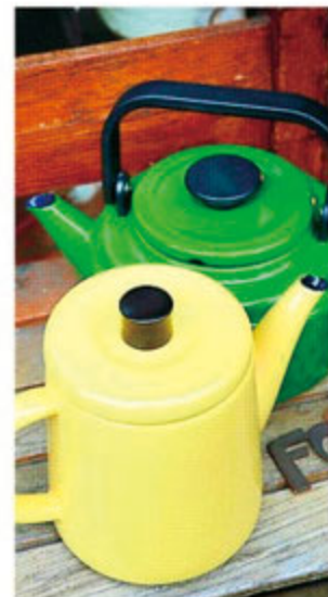
キッチンを明るくしてくれるポット やケトルは、ティータイムのお供に ぴったり。