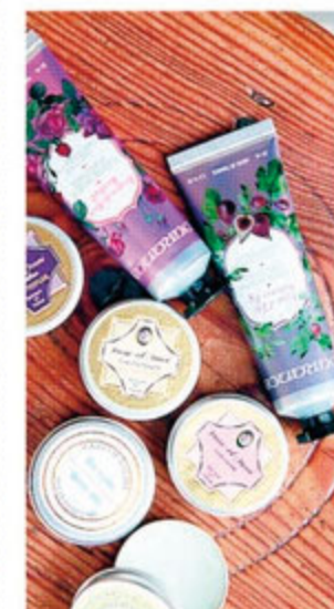
主張しすぎずふんわり香るので、そ の日の気分を使い分けたい。 練り香水/各 ¥1,200 ハンドクリーム/各 ¥1,300