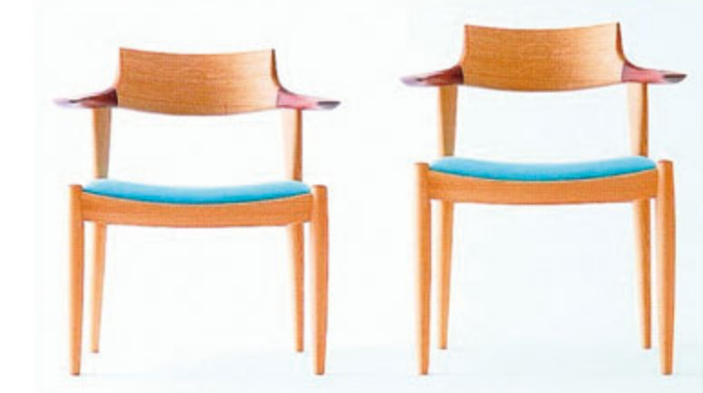
日進木工の「WHITE WOOD」シリーズ リビングダイニングチェア 張地は46色から選べる (左) W640×D555×H700×SH400 ※右は H750、SH440 ほかは同じ

新しいダイニングのスタイル 「LDチェア」 新商品でも写真やサイズが分かれれば大体 イメージはできる。けれど、この椅子を目 にした時、たくさんの方に驚かされた。 まず、座面がとにかく広い。座ってみると、 想像以上の心地良さ。改めて横から見 ると、前後の脚の長さを変えて横がり、や や後傾になっっている。どうりでゆったりと できるわけだ。また、座面の高さを低くし てあるので足の裏がしっかりと床につき、と びきりの安定感。ソファサイドで使っても マッチするから、くつろぎ重視の方にび たり、飛脚の家具職人が、「できる限り軽 く、頑丈に」と作ったものだから、毎日思 きり体を委ねても長く使える。ダイニング チェアとして食事を楽しむ、そのまわりビ ング感覚でくつろげるLDチェア。新しい ダイニングのスタイル、始めてみては？