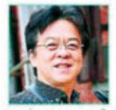
asten people 須川展也