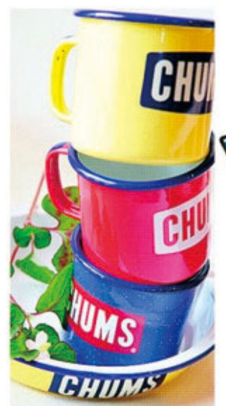
直火OKのホーローのビビッドな食器。コーヒータイムがハッピーに。 ポットロゴエナメルマグカップ/各¥1,200 ポットロゴエナメルディーププレート/¥1,500 (CHUMS)

SHOP INFORMATION NEST焼津店 焼津市東小川6-6-4 営/10:00~20:00 休/1月1日、不定休 tel: 054-626-7100