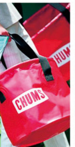
洗濯物や洗い物を入れたり水を運んだり、揃った生き物を持ち帰ったり...使い道は無限大! バケツ30リットル/¥5,800 14リットル/¥3,800 (CHUMS)