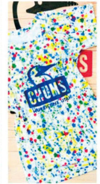
水辺のレジャーに欠かせないラッシュガード。大人用のジップパーカータイプもある。 キッズラッシュガードフープビートシャツ/ ¥3,900 (CHUMS)