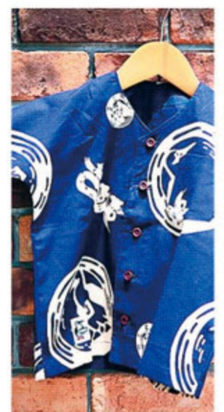
CHUMSと地元・ぬかや養蚕商店のコラボによって生まれた限定の魚河岸シャツは、粋に重宝な。100cm~。 魚河岸シャツ/キッズ¥9,000 (CHUMS)