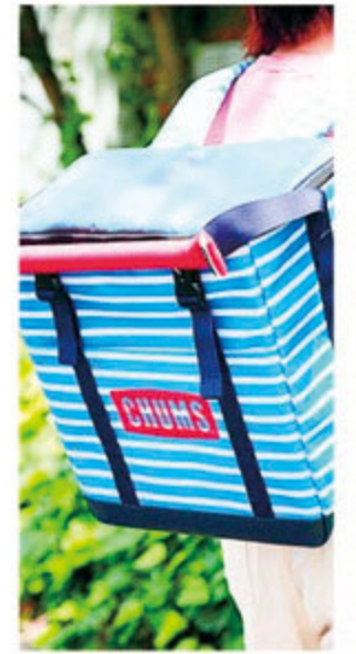
2Lのペットボトルを立てて運べるサイズ。大荷物にもうれしい、手持ちとデイバックの2way。 ハイウォータークーラーバック/ ¥9,800 (CHUMS)