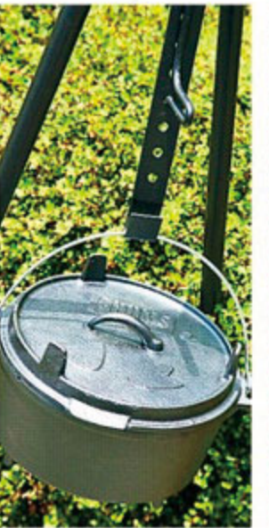
1台で「煮る、焼く、蒸す」ができるタッチオープン、アウトドアクッキングの必需品。SNSに映える一品を作ってみよう。 タッチオープン、トライポッド/各¥7,900 (CHUMS)