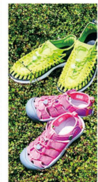
アクティブは足元から。水や泥をものともない水陸両用スニーカーは、アウトドアでもタウンユースでも活躍しよう。 LINEEK 02 / ¥11,000 キッズ¥6,000 (KEEN)