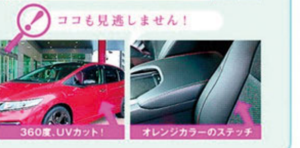
360度UVカット! オレンジカラーのステッチ