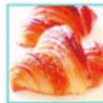
アステン5つ星 クロワッサン