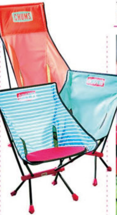
軽くて持ち運びしやすいチェアは、いくつあってもうれしい。あらゆる場面に連れて行って。 フォルディングチェアフープビート/¥11,000 フォルディングチェアフープビートハイ/¥18,500 シートパッド/¥2,000 (CHUMS)