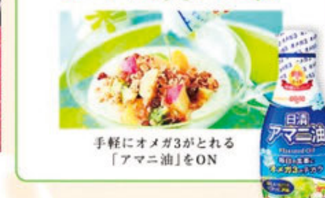
手軽にオメガ3がとれる「アマニ油」をON