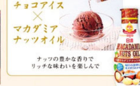
ナッツの豊かな香りでもリッチな味わいを楽しんで