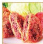
アステン5つ星 メンチカツ