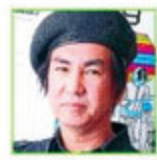
asten people 田島貴男