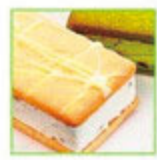
アステン5つ星 チーズスイーツ