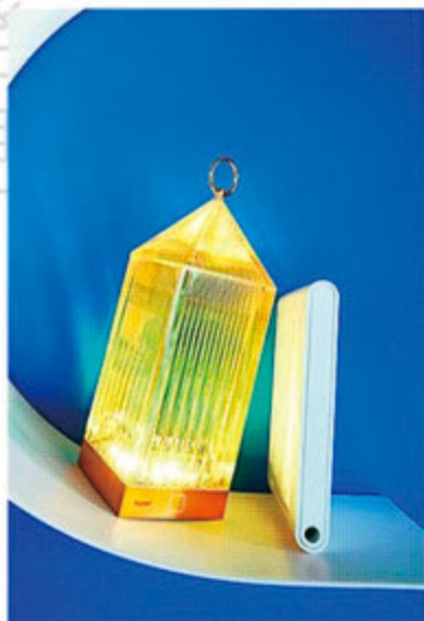
充電式のコードレス卓上ライト。点灯させると上品なカティングがぐっと際立つ。

光を受けてキラキラ輝く洗練されたデザインのアイテム。 気のおけない仲間とのホームパーティーも、日差しと遊ぶグランピングも、 ドラマチックな一場面に早変わり。