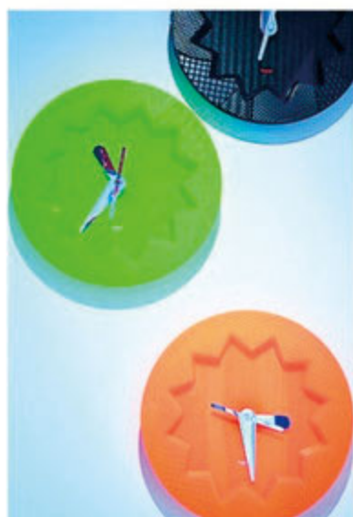
愛嬌(あいぎょう)あるルクスの壁時計。モノトーンとビタミンカラーの全4色。部屋の雰囲気でもっと楽しむ。