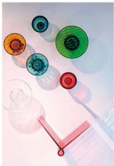
読みかけの本を置いたり、上着を掛けたり。壁さえもキャンパスにしてしまう華やかさ。

KITE SHELF/¥17,600 JELLIES COAT HANGERS/¥8,600~