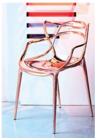
座り心地が良いダイニングチェアはスタッキングもできる。同シリーズのマットな質感のタイプ(¥32,600)も人気。