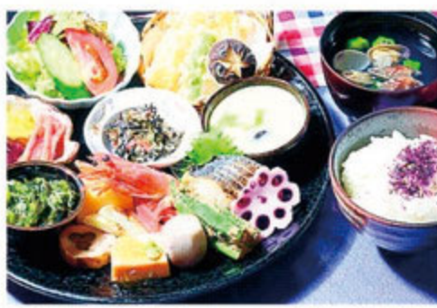
●「アステンを見た」の予約で日替わりデザートをサービス。

京料理のおばんざいをイメージしたおおよそ18品を大皿に。華やかさが人気の京風彩りランチが夏メニューで登場。それぞれが程よい量の女性にうれしい。ご飯・吸い物付きで1,800円(税別)。完全個室なので、京都旅さながらのゆったりとした気分が家族、友人とのひとときを楽しんで。