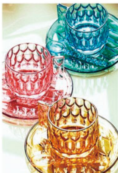
樹脂製で衝撃に強く都会的なテーブルウェアはアウトドアでも大活躍。冷蔵スプーンや冷たいデザートにも。

KITE SHELF/¥17,600 JELLIES COAT HANGERS/¥8,600~