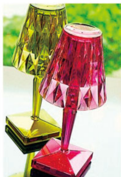
ランプシェードの形をベースにした、USB充電のLEDライト。コードレスだから移動も自在。