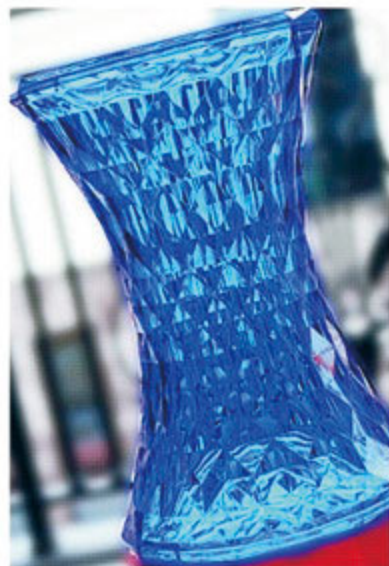
スツールとして玄関や洗面所に置いても、ソファ横でサイドテーブルとしても凛とした表情を見せてくれる。