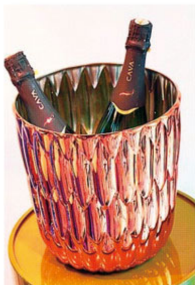
大人のグランピングは、キリッと冷やしたシャンパンで乾杯を。花びんとしても圧倒的な存在感を放つ。