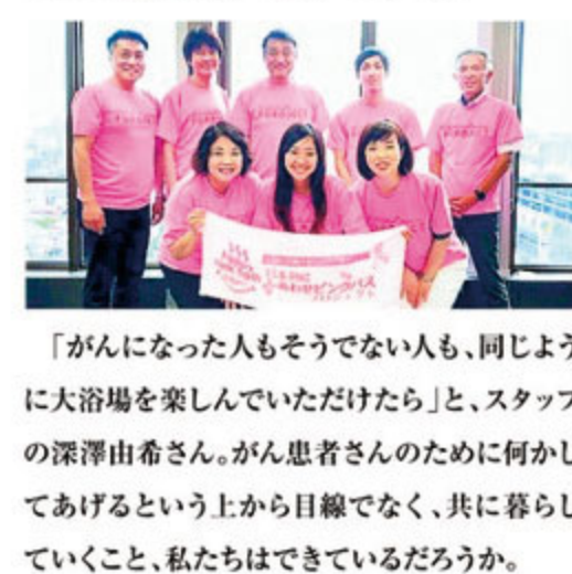
取材・撮影協力 | 認定NPO法人 オレンジティ | SHIZUOKA FUROJECT | 参加施設

ている「おっぱいリレー」という啓発活動に参加し、人工乳房を温泉に浸けても安心であることをアピールしている。一方、乳がん予防活動にも着目し、セルフチェックの参考になる触診モデルを館内に展示。さらに来月10月5日(土)6日(日)は、駿河健康ランドをはじめとした静岡県中部の温浴施設有志による「SHIZUOKA FUROJECT」が、ピンクリボン運動の一環として各施設の湯船をハーブエキス入りのピンクの湯で満たす。乳がんへの意識を高める活動は着々と広がっている。