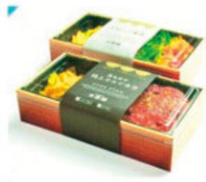
お弁当各種 968円(税込)~

キュイジーヌドタクミ 静岡市東区豊匠1丁目11-9 ◎11:30~15:00・18:00~22:00 定休日:木曜日 ●054-275-2355