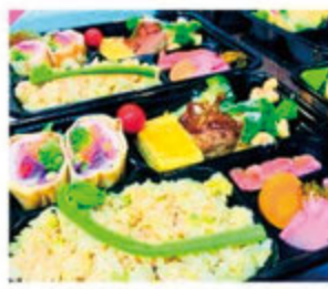
日替わり弁当 1,100円(税込)

本格こだわりフレンチをご家庭で 完全予約制で、その日の厳選された食材で作る 日替わり弁当。注文を受けてから時間に合わせて 作るこだわりのフレンチ弁当。前菜からメイ ンまでじっくり詰まった内容をご堪能ください。 ご予約は、前日22:00まで承っております。