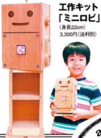
工作キット「ミニロビ」(身長22cm) 3,300円(送料別)

工作って年齢に関係なく夢中になれる。今回はそんな時間を生み贈り物、子どもたちの笑顔を作ろうとスタートして20年「えて静岡基地」の「ミニロビ」。樹齢約60年の静岡産杉材のパーツ・説明書・職人の磨き棒が1セット。木育ワークショップで活躍しているが、参加できない人々から要望があって販売開始。小学2年生以上なら1人で、小さな子でも大人と一緒に30分ほどで完成。お腹には小さな宝物を入れてもいいし、えて静岡基地の隊長からは「さみしくなったらお腹のタイルを触ってごらん。元気になるよ」とあの子に伝言です!