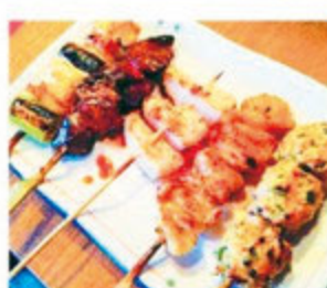
人気BEST5セット 800円(税込)

まぐろ一筋 みやもと 静岡市東区黒金町54番地3 アスティ静岡東館 ◎11:00~20:00(なくなり次第終了) 電話予約も承ります。 定休日:なし ●054-291-5720