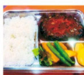
ハンバーグ弁当 800円(税込)

焼鳥家 日乃出 静岡市東区伝馬町9-14 ◎受け取り時間(時間外、応相談) 火、水、木 17:00~21:00 金、土、日 16:00~20:00 定休日:月曜日 ●054-253-1253