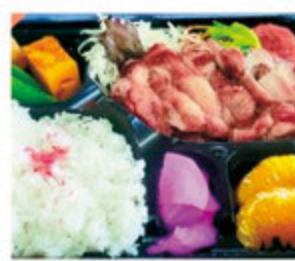
日替わりお弁当 各種500円(税込)

居酒屋 我 静岡市東区紺屋町4-14 フジビル2階 ◎17:00~ ※ランチは11:30~13:30 定休日:毎週月曜日・最終週火曜日 ●080-6979-2830