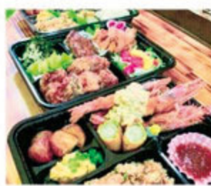
選べるおつまみ五品 1,000円(税込)

京風刺身 静岡瀬名川店 静岡市東区瀬名川3-26-15 ◎日~木 11:00~23:00(L022:00) 金土祝前日 11:00~24:00(L023:00) ●0120-17-8929