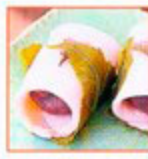
アステン5つ星 さくら色の食べ物