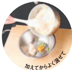
加えてからよく混ぜて