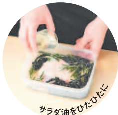
サラダ油をひたひたに

3 ボールに、枝豆と卵黄を入れ、2を加えてよく混ぜ合わせる。焼き上がった1を食べやすい大きさに切り、盛り合わせる。 ※トッピングはパルメザンチーズのうす焼きとローズマリー。