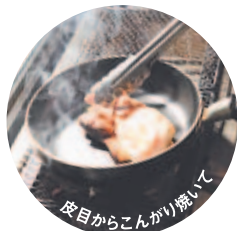
皮目からこんがり焼いて