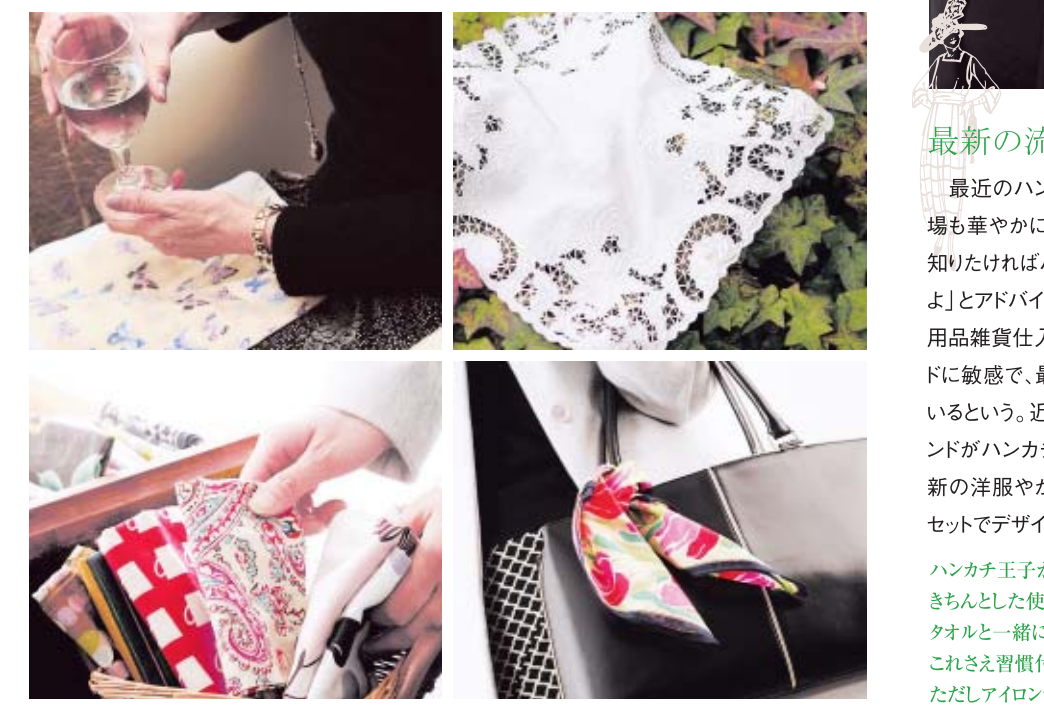
取材協力 >> 松坂屋静岡店 / tel.054-254-1111 ブルーミング中西 / tel.0120-030-632 ニシオ / tel.06-6251-1801

の贈り物”として活用され、恋人にイニシャルや紋章入りのものを贈ることが盛んになった。かのマリー・アントワネットもハンカチを愛し、四角形に定める法令を出させたという。現在、彼女の誕生日に近い祝日11月3日は「ハンカチーフの日」に定められている。上流階級のアイテムが大衆へと浸透したのは19世紀に入ってから。安価な綿製品が作られるようになると世界中に普及し、日本では明治以降に広がっていった。