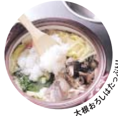
大根おろしはたっぷり!