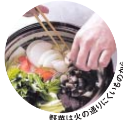
野菜は火の通りにしむものから