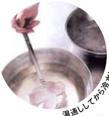
湯通してから冷水にとって