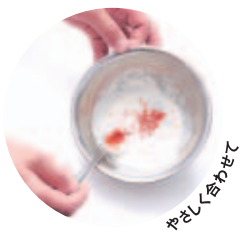
やさしく合わせて