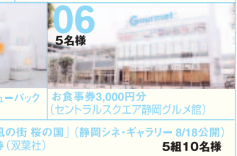
06 5名様 お食事券3,000円分 (セントラルスクエア静岡グルメ館)