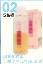
02 5名様 温泉化粧水 (川根温泉 ふれあいの泉)