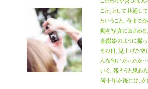
取材・撮影協力 / 四葉商会 TEL:054-251-1048 / 文具のダイワ TEL:054-262-2573 / SBT http://yaplog.jp/sbt_yhyh_3/ スムアイ TEL:054-265-3434 / 松坂屋静岡店 TEL:054-254-1111

こだわりや喜びは人それぞれ。でもスクラップブックを始めてから「変わったこと」として共通していたのは、毎日のちょっとした出来事も見逃さなくなった、ということ。今まで捨ててしまっていた切符や半券をとっておく。瞬間の感動を写真におさめる。その時に何があったかを書き残す作業。それまでただ記念撮影のように撮っていた写真も、生き生きとした表情のものに変わっていく。その日、見上げた空はどんな色だったか、道端に咲いていた花はどんな形で、どんな匂いだったか...、その時に感じたことが、鮮やかな思い出となって残っていく。残そうと思わなければ残らない思い出もある。その出来事はもしもしたら、何十年か後には、かけがえのない宝物になるかもしれない。