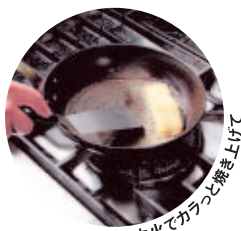
中火でカラッと焼き上げて