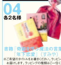
04 各2名様 書籍「奇跡を呼ぶ魔法の言葉」 「年下恋愛」(すみや) ※ご希望のタイトルをお書きください。ラッピングして お届けします。ラッピングの種類はご一任ください