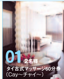
01 2名様 タイ古式マッサージ60分券 (Cay〜チャイ〜)