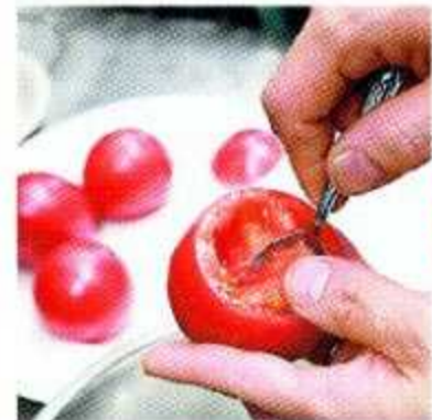
トマトをくりぬいて