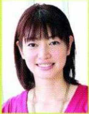
asten people 弥生