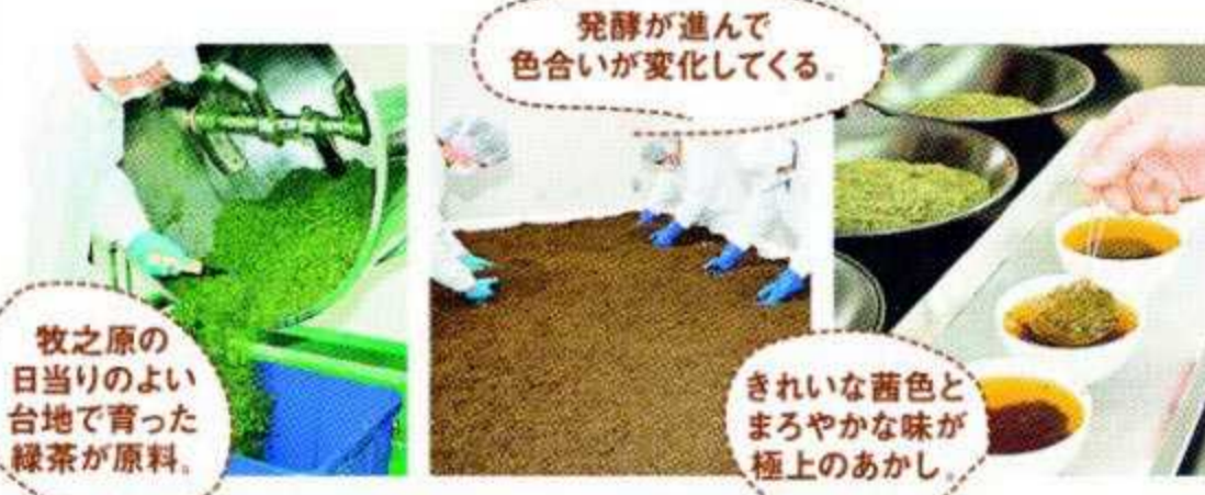
牧之原の日当りのよい台地で育った緑茶が原料。

※1/河村傳兵衛氏:静岡県を吟醸酒王国にみちびいた発酵技術の第一人者。 ※2/没食子酸:カテキンが変化してポリフェノールの一種。 ※3/重合ポリフェノール:複数のカテキンが結びついたポリフェノール。