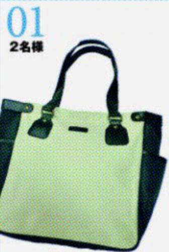
01 2名様 リーガルオリジナルトートバッグ [リーガルシューズ静岡七間町店]