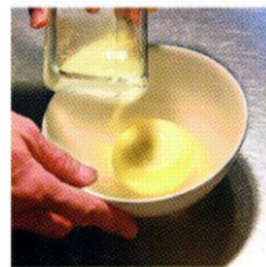
ブイヨンと蒸して