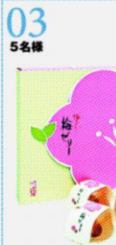
03 5名様 梅ゼリー(6個入り) [梅の花 静岡店]