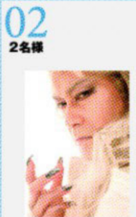
02 2名様 ドラキュラ伝説~千年愛~ 静岡公演 5/25(火) 静岡市民文化会館 ペアチケット(夜の部 S席)