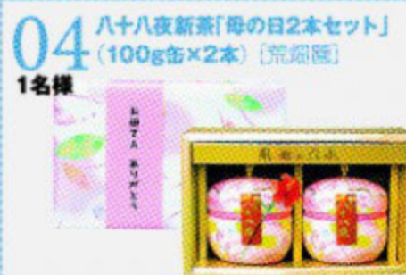
04 八十八夜新茶「毎の日2本セット」 (100g缶×2本) [荒瀬園] 05 3名様 歯ブラシホルダー [デンタルオフィスコムカイ]