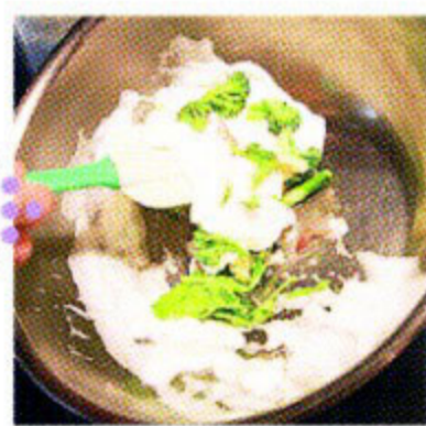
メレンゲを作って