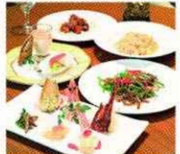
※料理写真はイメージです

時には気品あふれた雰囲気の中でチャイニーズはいかが? 静岡グランドホテル中島屋B1「チャイナコート」では鉄人・陳建一氏監修の四川料理が堪能できる。季節の食材を使ったモダンな料理と中国茶付きの「ゆったりレディースランチ」(2,500円)は全日楽しめるお得なコース。食事とデザートが3種類の中からチョイスできるのも魅力。上質空間には個性的なブラス席も備えられ、特別な日にも大いに活用したい。大人のためのきめ細やかなホスピタリティはホテル直営店ならではの。ディナーは一人5,000円〜。