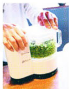
トロツとなるまで混ぜて