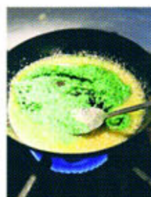
ペーストと合わせたら