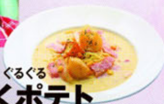
アステテン meets ぐるぐる ほくほくポテト