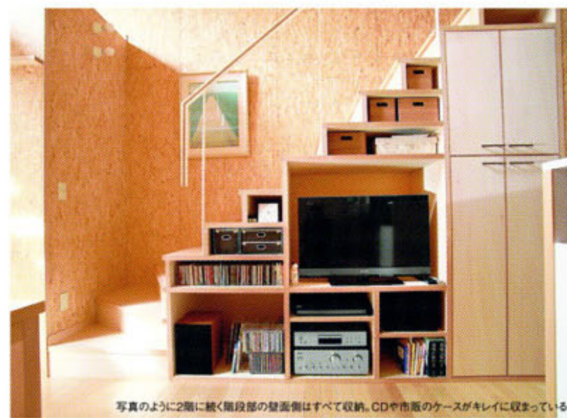
写真のように2階に続く階段部の壁面側はすべて収納。CDや市販のケースがキレイに収まっている

今回、取材に訪れたのは静岡市内の住宅地に建つT邸。狭小住宅でありながら、収納にはまだゆとりがある。売れっ子建築家が考える狭小住宅の収納のヒミツとは？