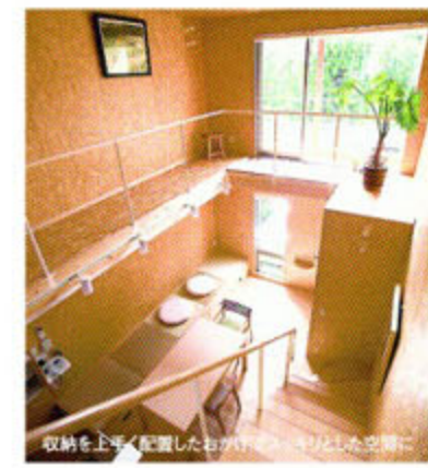
収納を上手に配置したお部屋。ゆとりある空間に

でも、この先に買うものの収納場所は？という答えには「定型サイズ」が鍵となる。「A4ファイルや収納ケースなどの一般的なサイズに合わせて収納を造っておけば、後で『丁度いいサイズがない!』などと困らずに済みます」と松永さん。大工造りやオーダーではサイズも自由にしがち。使用目的が幅広い収納の幅や奥行きは定型サイズにした方が何かと便利で、金額も抑えられる。お役立ちアイテムは大手メーカーのカタログ。高さや奥行きなどサイズの目安が分かる。収納上手に変身するよりも、片付けラクな収納づくりの方が早そうだ。