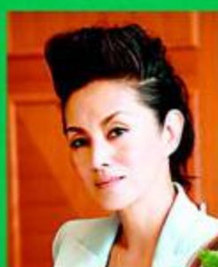
asten people 夏木マリ