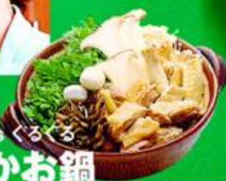
アステン meets ぐるぐる あったかお鍋