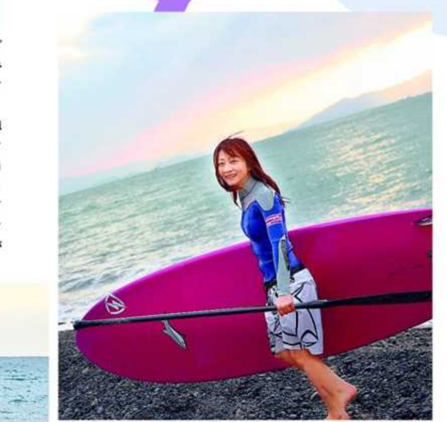
取材・撮影協力 / NPO法人M-nop スポーツショップアラジン静岡 TEL:054-293-9333 自然体験活動 響樹 マカニサーフ カイトサーフィンスクール TEL:090-1478-4747 エクストリームアイロニングジャパン