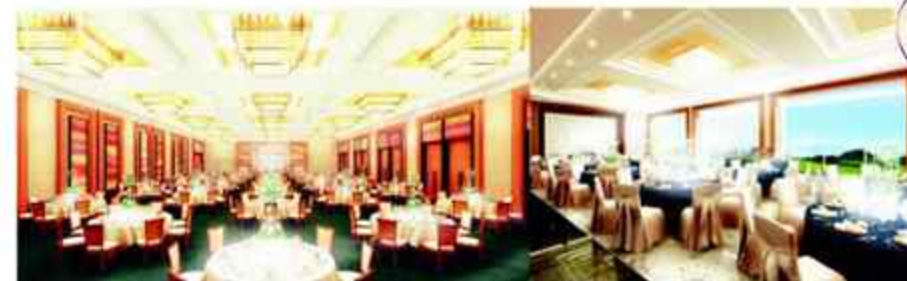
ボールルーム(日本平)

最新の音響設備が充実し、スケール感や開放感に満ちたボールルームや、ガーデンとの調和が美しいバンケットルーム、最上階からの眺めが楽しめるアッパーバンケットなど、多彩な会場がパーティの舞台に。