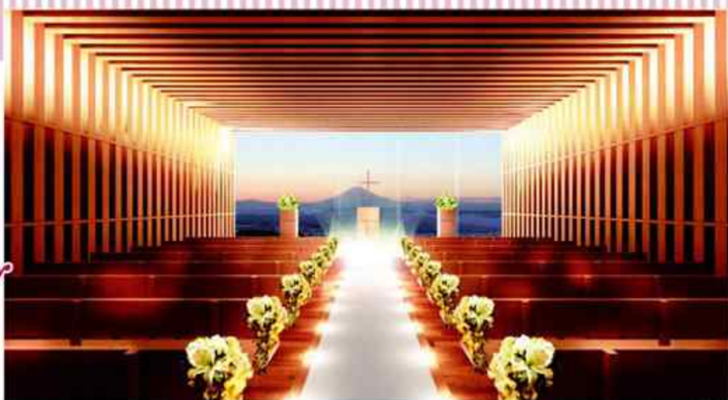
ホテルウエディング

未来に向けた大切な始まりの日…。日本平ホテルウエディングは自然の中、お二人の自由な発想でつくり上げる「心かよい合う 本物のとき」をお手伝いします。新しい出発のお二人と共に、新しい日本平ホテルもスタートします。