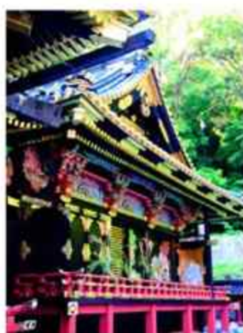
久能山東照宮挙式

国宝に指定された久能山東照宮での挙式。約400年前の姿を今に残す神前式で、伝統美溢れる神前式を。