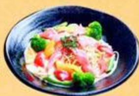
アステン meets ぐるぐる 彩りパスタ