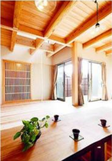
天竜杉、安倍川のヒノキ、調湿性の高い霧島壁を使う。職人技と設計、デザイン性にも優れている。

野沢工務店は、静岡市のみで家を建てることにこだわった地域密着の工務店。無垢の天然木は反ったり、曲がったりが付きもの。建てた後に調整できるよう、すぐ駆けつけられる場所だけにしていく。初代が木工ということもあり、木の扱いと施工に長け、大工造りで作ったキッチンや棚など、手触りが滑らかで美しい。この会社が推奨しているのが、これからのスタンダードとなる日本古来のパッシブソーラー。自然の風と光を取り入れ、電力に頼らなくても夏は涼しく、冬は暖かい。躯体を構造材で丈夫に作り、長年住み続けるように可変性が高いのも特徴。