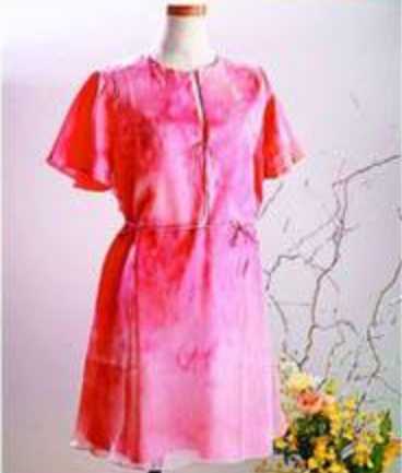
イタリアンブランド「フランチェスカ」や「カルロタリ」など春夏の新作が続々登場!

アンティークの調度品がヨーロッパの雰囲気を感じる「Stella」は、2012年11月にオープンしたセレクトショップ。扱うブランドはミラノの「ナディーネ」やパリの「ラマンティス」など、ヨーロッパからの直輸入品ばかり。日本初上陸も多く、個性的で、フォーマルにもカジュアルにもコーディネート次第で幅広く使えるアイテムが揃う。天然素材をはじめ上質な素材や体を美しく見せるカットワーク、ヨーロッパならではのカラー展開など、おすすめアイテムはいろいろあるが、なんといっても手に取りやすい価格が魅力。カッターもワンピースも1万円代で揃うのは、シーズンごとに現地に赴き、価格交渉をしているから。今後、靴や帽子など小物も充実していくので楽しみに。