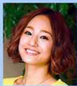
asten people 千紗