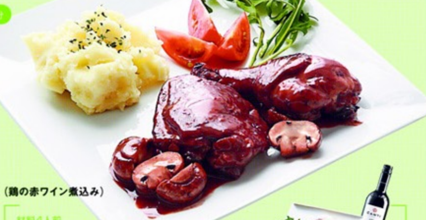
(鶏の赤ワイン煮込み)