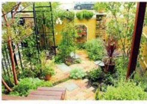
施工例はこちら シーズン静岡 作品集 060

ご夫妻でガーデニングが趣味というYさん。昨年、築20年の家のリフォームに合わせてエクステリアを一新。庭へと姿を変えた空間は、もともと車2台ほど停められる駐車場だったそう。限られた空間の中、まずリビングの高窓をはき出し窓にし、室内と庭の繋がりを覚えるウッドデッキを設置。ガーデニンググッズを収納できるベンチや、強い日差しを和らげるシェードで、実際に機能するアウトドアリビングが完成した。種類豊富な草花は、季節になると毎年庭を彩る宿根草を多くセレクト。冬場は庭が寂しくなりがちだが、アンティークのレンガやマーブル調に仕上げた塗り壁が、温かみをプラスしてくれる。念願の庭を手に入れ、定年後の暮らしを満喫するYさん。今後、さらに見応えある庭になるだろう。