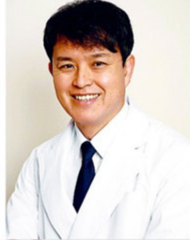
荒浪先生は地元出身。だから、不安なことは相談してみよう。

約15年前から島田で皮膚科を続けているあらなみクリニックでは、長年薄毛治療の研究をしている院長が、薄毛のさまざまな治療法に対して医学的検証を行い、日本皮膚科学会認定皮膚科専門医として薄毛治療を提供している。また美容皮膚科部門もあり、シワやシミ、たるみ、くすみや肝斑、毛穴、多汗症治療の他、ワキガ治療のための塗り薬の研究開発もしている。今まで何をやっても薄毛が改善しなかった人や、肌のトラブルで悩んでいる人は、ぜひ相談してみてください。詳しくは下記ホームページで。