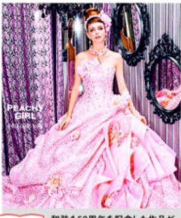
ココに注目! 和装も50周年を記念した作品が発表される。契約いただいた花嫁には嬉しいプレゼントが!

南幹線沿いのマイウエディング中屋が創業50周年を記念して、9/13~23まで「50th Anniversary Fair」を開催。今注目を集めている繊細で上質感漂うシンプルドレスや、大人っぽい雰囲気のスタイリッシュなドレス、とびきりキュートなカラードレスなど、人気ブランドからオリジナルまで多くの新作がずらりと揃う。50周年の感謝を込めて、今回は記念ドレスも発表されるので、この機会をお見逃しなく! 的確なアドバイスで評判のドレスコーディネーターが、あなたのスタイルや雰囲気にぴったりの衣装を提案してくれるので、なりたいイメージを遠慮なく相談してみよう。きっと運命のドレスに出会えるはず。人気イベントのため、あらかじめ予約を。 ●事前予約制 申込みは 054-287-1122 まで