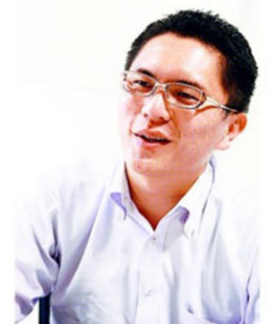
佐野さんによると、家族や友人、知人に相談し、「いいと思うよ」という評

「静岡のお客さんは保守的だとよく言われますが、確かに住宅に関してもそれは感じますね。一つの決断をするまでに、周りの意見をよく聞き、それを尊重する方が多いんです。逆に言えばなかなか決められない、ということでもあるんですが、慎重であることは住宅購入に関してはそんなに悪いことではないと思います」