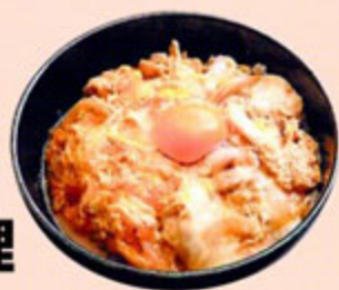
アステン meets ぐるぐる ふんわり卵料理