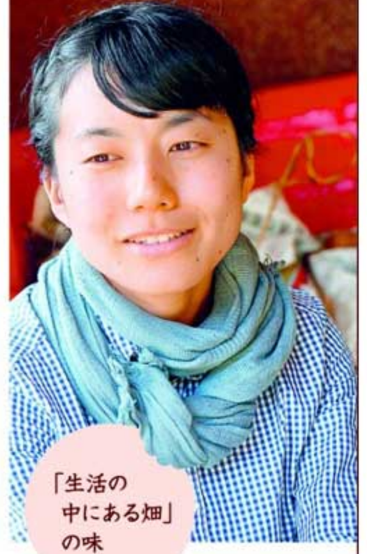
「生活の中にある畑」の味

日本が世界に誇る「和食」は、季節ごとの自然を味わうもの。それなら、静岡の豊かな自然の中で暮らす人々は最高においしい和食を知っているのでは？ そう思って山や海を訪ねてみたら、静岡をもっと好きになるご馳走が待っていた。