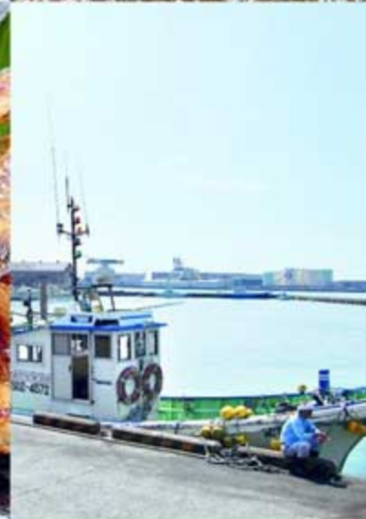
取材・撮影協力 / プロジェクトZ・在来の味を愉しむ会 手打ち蕎麦たがた 大井川漁業協同組合 静岡水産技術研究所 食彩美酒 佐助-WABISUKE-