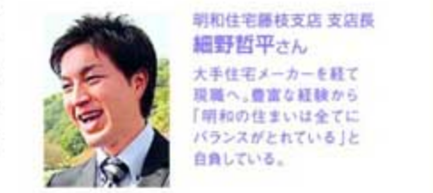
取材協力 / 藤枝市企画政策課 企画政策課・明和住宅