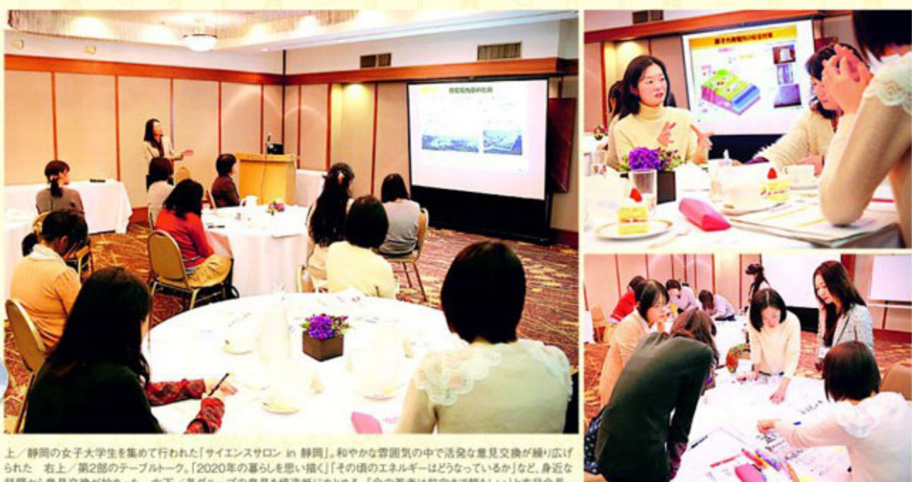
上/静岡の女子大生を集めて行われた「サイエンスサロン in 静岡」。和やかな雰囲気の中で活発な意見交換が繰り返された。右/第2部のテーブルトーク。「2020年の暮らしを思い描く」「その頃のエネルギーはどうなっているか?」など、身近な話題から意見交換が始まった。右下/各グループの意見を模造紙にまとめる。「今の若者は前向きで頼もしい」と布目会長

第1部の情報共有は「これからのエネルギーをどうする?」がテーマ。冒頭では日本のエネルギー自給率の低さを布目会長が解説。資源の乏しい日本で必要な電力をまかなうためには、石油、石炭、天然ガス、ウランなどの燃料を海外から輸入せざるを得ず、その依存率が約9割という実情が示されると会場内ため息が漏れる。中盤では火力発電、原子力発電、再生可能エネルギー(太陽光、風力、水力、地熱)のメリットとデメリットを多角的かつ客観的に解説。二酸化炭素の排出量だけでなく、環境保全、コスト、安全性、安定供給など、さまざまな観点から比較した情報に参加者は目を見張る。終盤は国内の原子力発電所の状況、福島第一原子力発電所の現状、浜岡原子力発電所の安全性向上対策に関する情報提供が行われた。中でも静岡県にある浜岡原子力発電所への関心は強く、海抜22mの防波壁、原子力建屋の強化扉や水密扉、複合的なバックアップ電源などの解説が始まると会場の空気は熱気を帯びた。布目会長が最後に語ったのはエネルギー問題を考える時のさまざまな視点。地球温暖化や安全性だけでなく、生活スタイル、地域的な公平性、世代の公平性、経済成長、コスト、安定供給などを総合して、これからのエネルギーを考えるべきだと訴えた。