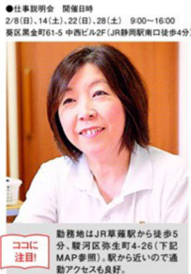
ココに注目! 勤務地はJR草薙駅から徒歩5分...