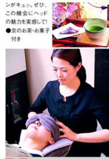
ココに注目! アستن特別プラン ①全身40分+