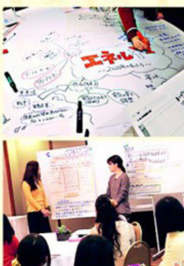
上/エネルギーの観点から日本の未来予想図を描いたグループの模造紙。下/各グループの発表シーン。他グループがどんな議論をしたか、真剣な表情で見つめる参加者

第2部のテーブルトークは、参加者が3グループに分かれて進められた。各グループの進行役は「WiN-Japan」のメンバーが務め、「エネルギーに関してこれから取り組むべきことは何か」を語り合った。その内容に耳を傾けてみると「日本の電力事情が逼迫していることが不安」「将来のエネルギー事情を見据えて今の暮らし方を改