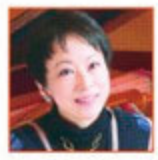
asten people 熊本マリ

* 撮影協力/ atelier Hjärta(アトリエエイッタ) TEL.054-297-5122