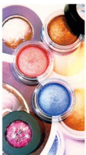
たった1色、指1本で重ねるだけ。華やかな濃淡のグラデーションを生み、目元を立体的にする。