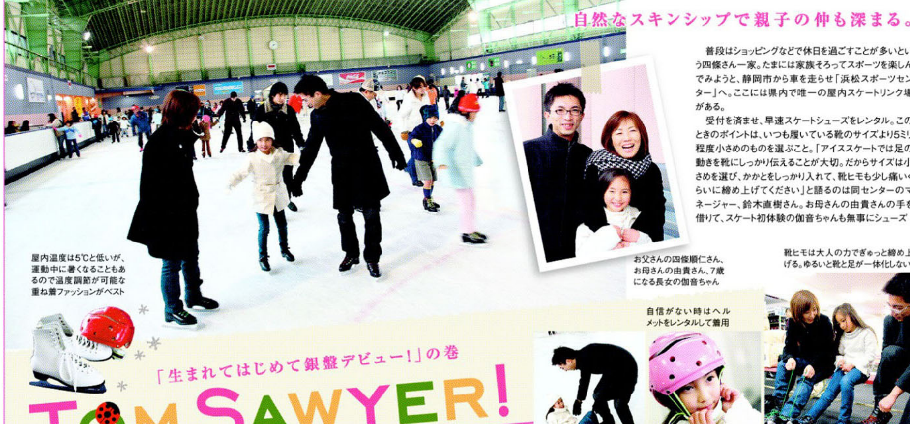
自然なスキニップで親子の仲も深まる。

●最新カタログ無料プレゼント! ご希望の方は下記のフリーダイヤルまで。 AKAISHI 静岡市駿河区丸丸6955-3 フリーダイヤル0120-716-661 http://footcarejapan.com